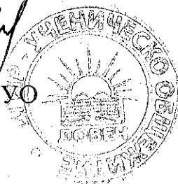
График и дейности за дистанционна форма на работа на груповите възпитатели за периода 13.04.2020 година до 13.05.2020 година в ситуация на извънредно положение и в изпълнение на Заповед № 149 от 07.04.2020 година на Директора на ЦПЛР УО Ловеч

I. Дейности за дистанционна форма на работа на груповите възпитатели в условията на извънредно положение